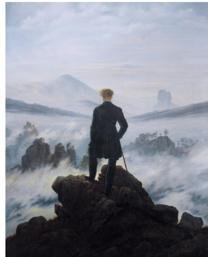
Caspar David Friedrich, Caminant sobre una mar de boira , 1817