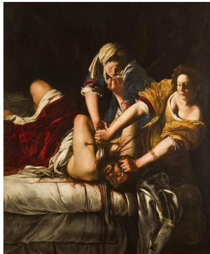
Artemisia Gentileschi, Judith decapita Holofernes , 1612-1613