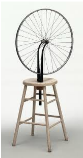
Marcel Duchamp, Roda de Bicicleta , 1913