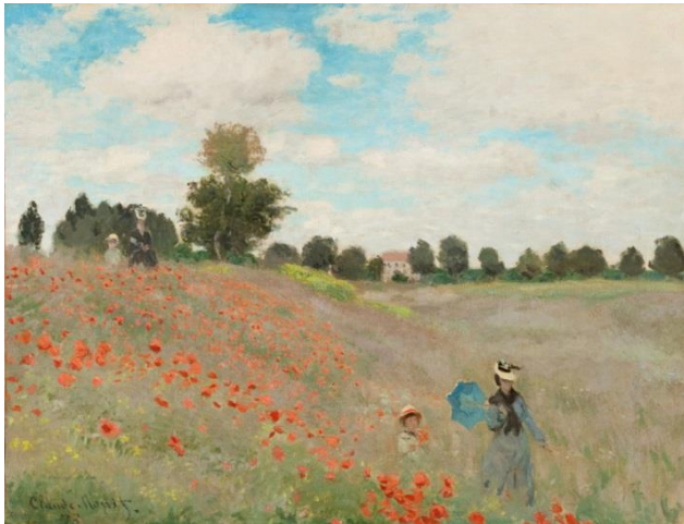
Claude Monet, Roselles , 1873