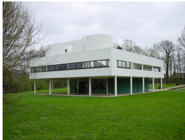
Le Corbusier, Ville Savoye, 1928