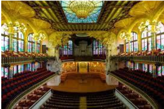
Lluís Domènech i Montaner, Palau de la Música Catalana, 1905