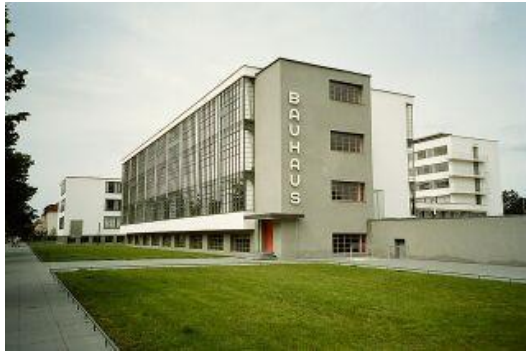
Walter Gropius, edifici de la Bauhaus a Dessau, 1925