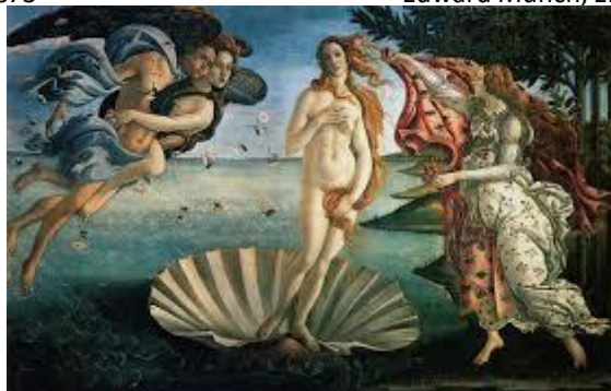
Sandro Botticelli, El naixement de Venus , 1485-1486