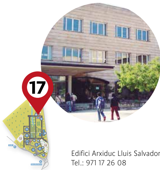
Edifici Arxiduc Lluís Salvador Tel.: 971 17 26 08

Com alumne del Grau en Direcció Hotelera coneixeràs i et familiaritzaràs amb l'activitat turística en general i amb el sector hotelier en particular. Adquiriràs coneixements orientats a la direcció d'empreses en el sector de l'hoteleria, l'allotjament i la restauració i realitzaràs pràctiques en empreses en entorns nacionals i internacionals. Adquiriràs competències en l'aplicació de principis de direcció i gestió bàsics en els diversos departaments i àrees operatives per a la millora contínua de l'empresa hotelera. També coneixeràs i podràs aplicar al sector hotelier coneixements d'economia, dret, geografia, noves tecnologies i recursos humans, amb capacitat per al treball en equip i adaptar-te a nous entorns en un sector altament dinàmic. Tot això, amb un alt nivell de formació en idiomes, tant anglès com alemany.