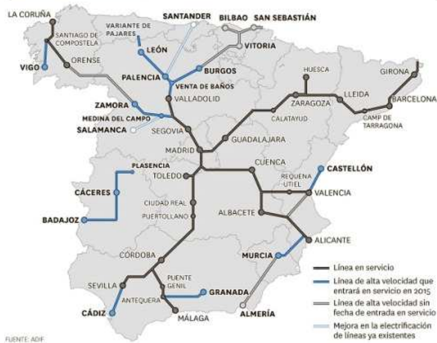
EL MAPA DEL AVE EN ESPAÑA

(El espacio para responder es esta página y su cara posterior. La respuesta ha de ser razonada o indicar los valores que la justifiquen. Cabe indicar claramente el número de la cuestión que se responde).